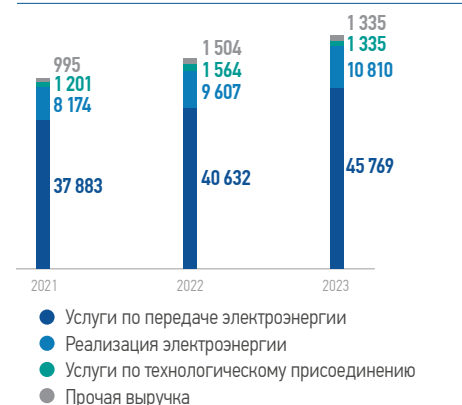
Структура выручки, млн руб.

1 Основные финансово-экономические показатели Группы по МСФО за 2023 год подготовлены на основе консолидированных данных с учетом внутрихозяйственных операций с АО «Псковэнергосбыт». В консолидированной финансовой отчетности ПАО «Россети Северо-Запад» за 2023 год АО «Псковэнергосбыт» (вид деятельности – реализация электроэнергии, сегмент Псковэнергосбыт) классифицирован как прекращенная деятельность в соответствии с МСФО (IFRS) 5. В связи с этим в отчете о прибыли или убытке и прочем совокупном доходе результаты деятельности по прекращенной деятельности были представлены в отдельном блоке с пересчетом сравнительной информации без изменения финансового результата за 2022 год. Данные о выручке и операционных расходах представлены без элиминации внутригрупповых оборотов с выбывающим сегментом для отражения эффекта продолжающихся отношений. В отчете о финансовом положении на 31.12.2023 активы и обязательства выбывающего сегмента выделены в отдельные строки.